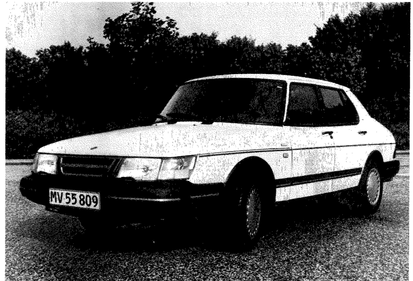
Fra denne vinkel er det kun de sorte vinduesrammer, der fortæller, at det er en 1988-model. Vigtigere er det, at 900-modellen har fået 9000-modellens bremsesystem og at i-modellen har fået servostyring.