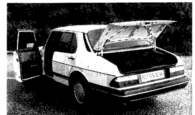
Bagagerummet er stort og regulært, men læsekanten er lidt høj. Bagsædet kan lægges ned. Her var Saab pioner. Mange andre fabrikkers er siden fulgt efter. Bemærk, hvor nemt det er at stige ind på grund af den dybe dør.